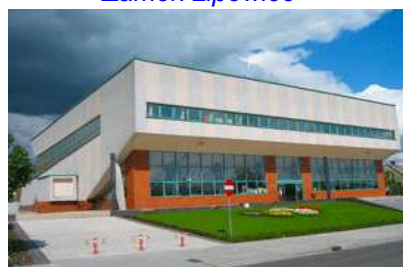
Obiekty Sportowe Turnieju Caban – Cup 2014 hala w Chrzanowie