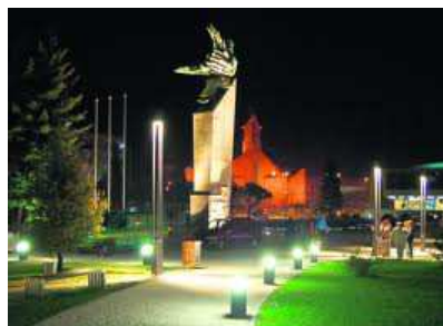
Plac Tysiąclecia w Chrzanowie