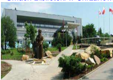
hala w Libiążu